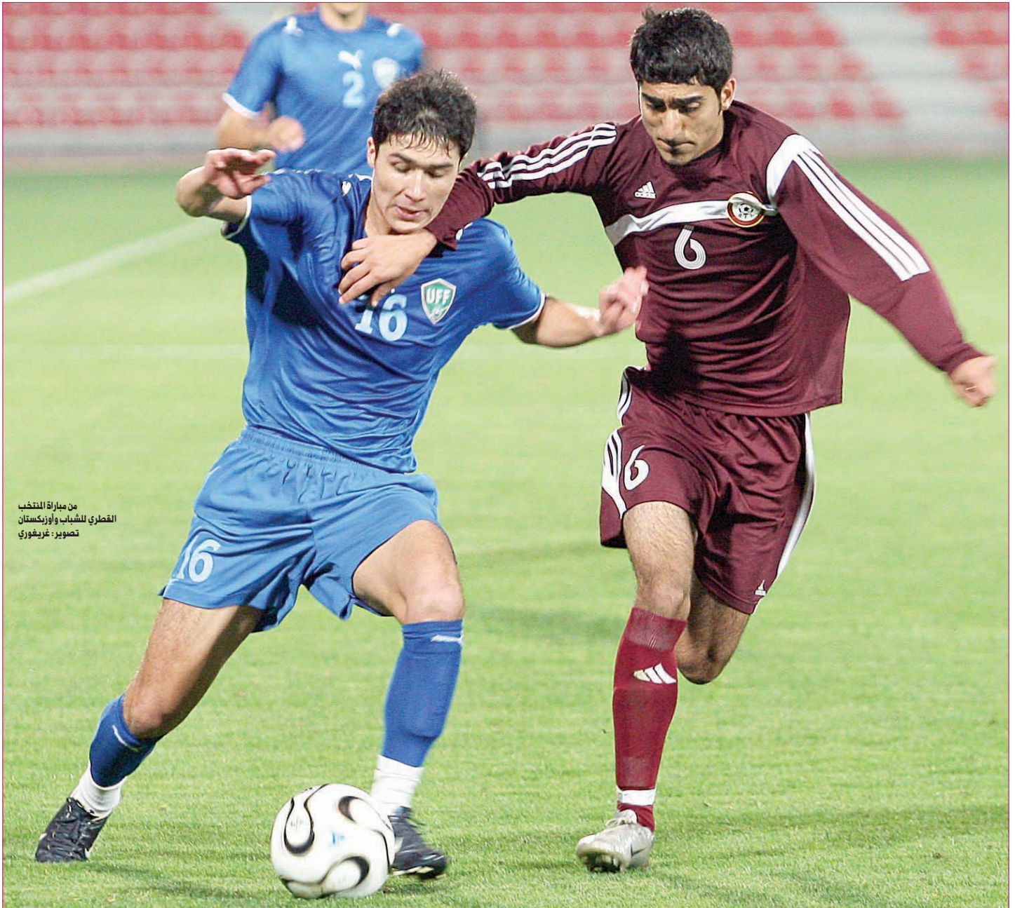
من مباراة المنتخب القطري للشباب وأوزبكستان